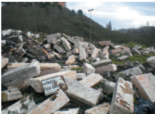
Prima della bonifica...

I costi della bonifica sono stati sostenuti dall'impresa che stava realizzando i lavori di manutenzione stradale in Via di Mezzocammino.