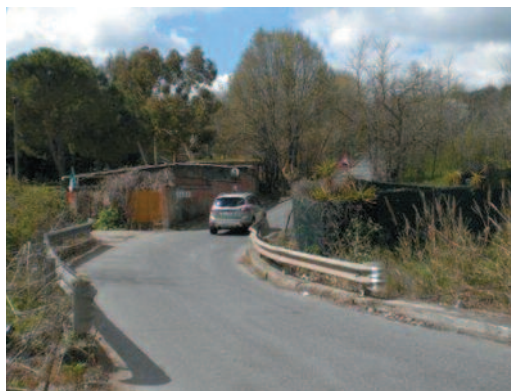
L'entrata a Vitinia, attraverso il ponticello di Via Lagosanto

La Realizzazione della rotatoria di Via Alfonsine (pericolosissimo incrocio che da Via di Mezzocammino conduce alla Via Cristoforo Colombo), è stata già finanziata con il Contratto di quartiere Tre Pini – Mezzocammino, che però è ancora fermo.