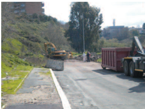
La bonifica del Parco di Spinaceto