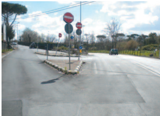
Rotatoria Via di Mezzocammino intersezione Cristoforo Colombo

Brunori - Mostacciano (se non troverà copertura finanziaria in altro modo);